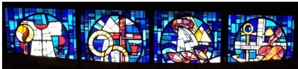
Fenster in Allerheiligen