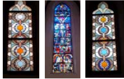
Kirchenfester Herz Jesu