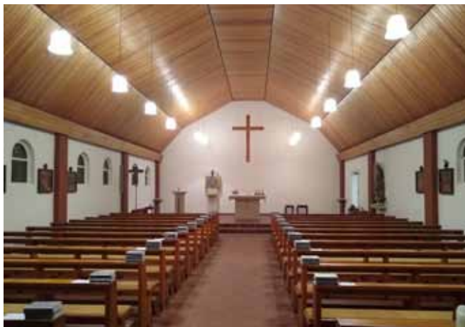
Innenraum St. Marien Maternitas