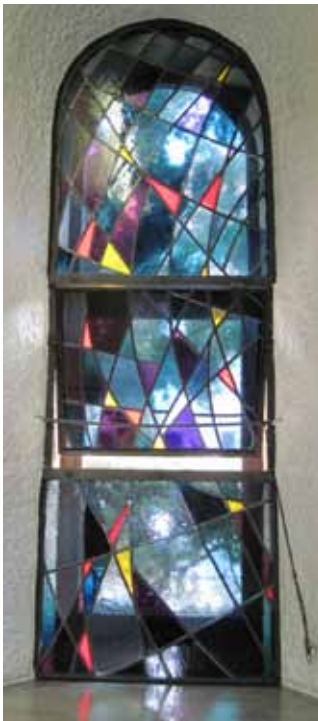
Fenster der St.Rita - Kapelle

Wenn Sie nicht wünschen, dass Ihr Name hier genannt wird, dann wenden Sie sich bitte an das Pfarrbüro (2097 88 80). Selbstverständlich respektieren wir Ihren Wunsch.