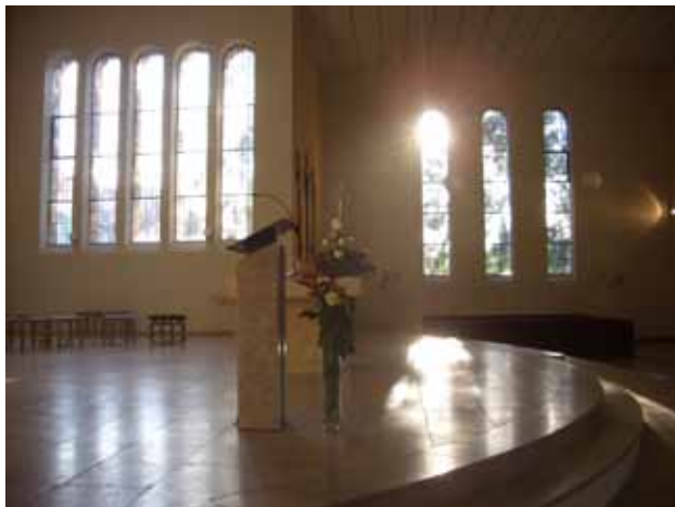
St. Rita Altarraum

Mittwoch, 26.02.2020 18.30 Uhr Aschermittwoch Hl. Messe mit Aschenkreuz