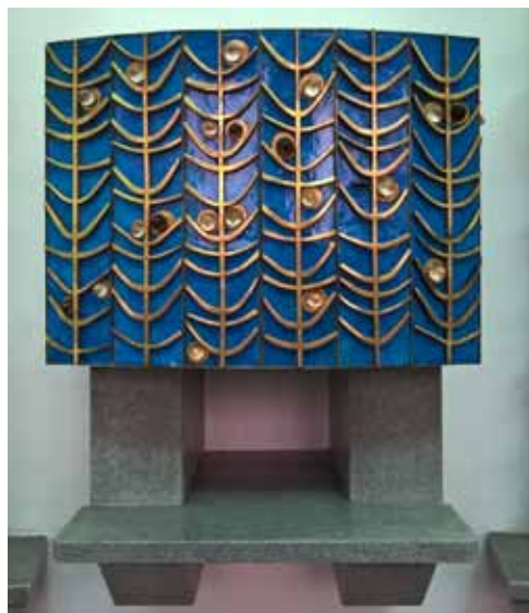
Tabernakel in St. Bernhard