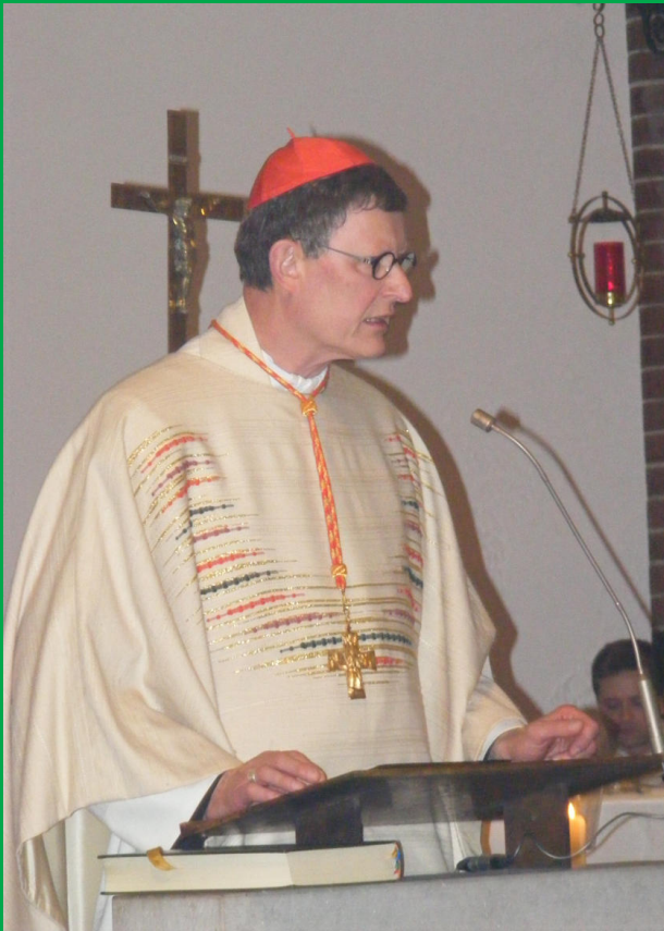
Visitation und feierliches Pontifikalamt durch unseren Kardinal Rainer Maria Woelki am 20. April 2012