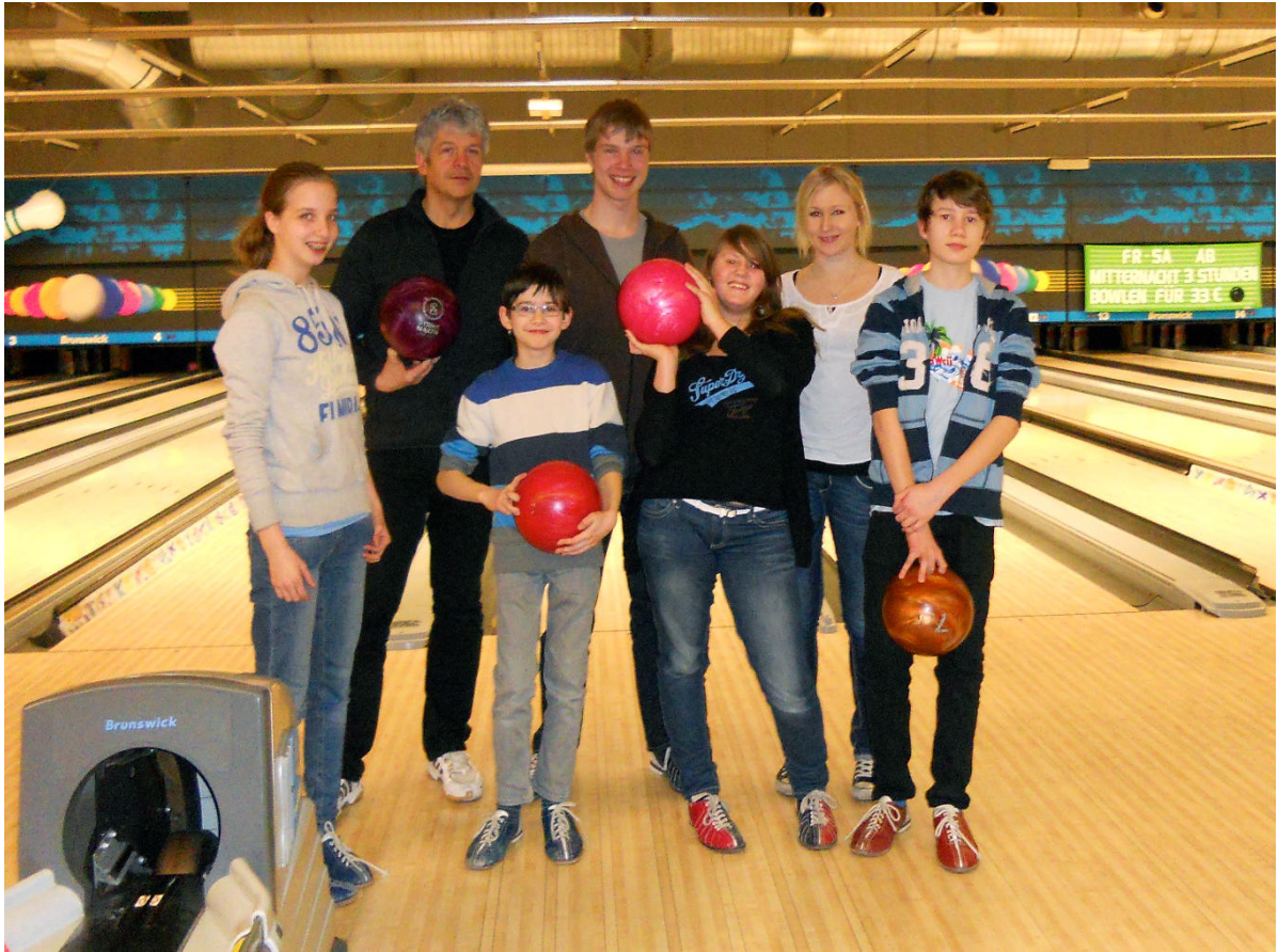
Ministrantengruppe unter „Anleitung“ beim Bowling