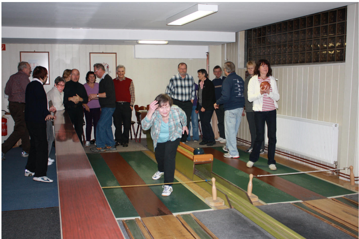
Elternkreis Altersgerecht beim Kegeln