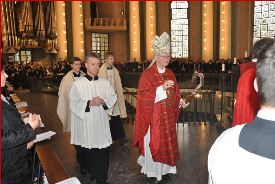
Firmung des Dekanates Reinickendorf Süd am 19.2.2012 in der Hed- wigskathedrale