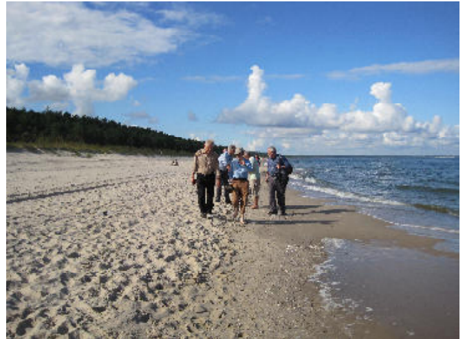
Diskussion der Wanderwegzustände