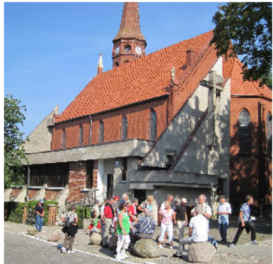
Wanderziel St. Petri - fast ohne Diskussion

Die Höhepunkte waren: Strandwanderungen, Stadtbesichtigungstour mit St. Petri, Nationalparkwanderung, Wisentgehege, Kaffeeberg und Fischessen am Strand. Alle 23 Teilnehmer haben die Wanderungen und diversen Mückenangriffe gut überstanden, und auch die wenigen mutigen Schwimmer trugen keine sichtbaren Schäden davon, sondern nur die Bewunderung der kälteempfindlichen und/oder wasserscheuen Gruppenmitglieder.