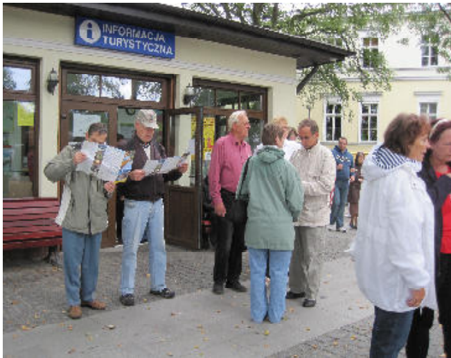
Diskussion der Wanderwegvorschläge

Dank optimierter Planung war es eine tolle Reise bei herrlichem Wetter, eventorientierten Wanderungen, prima Unterkunft in einem Wald- und Wellness-Hotel in tierreicher Umgebung und direktem Strandzugang, und das alles zu einem rentenverträglichen Preis.