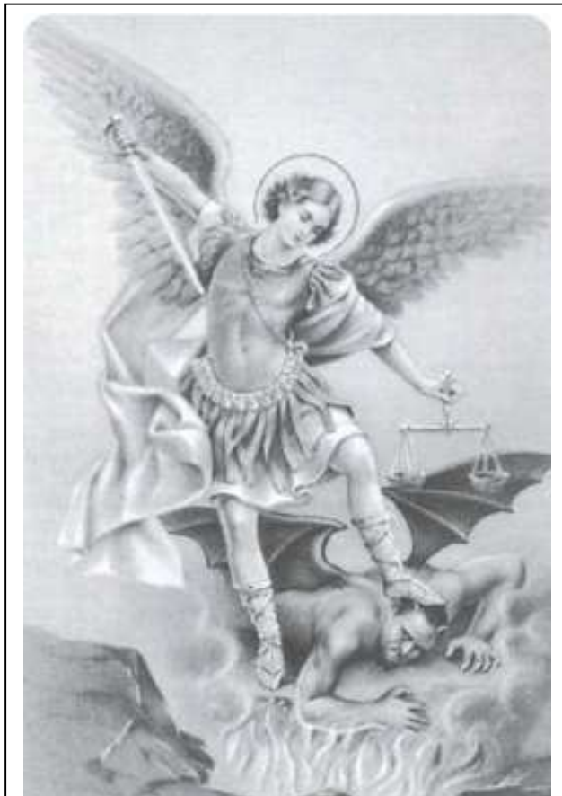
Die Kirche feiert am 29. Sept. die hl. Erzengel Michael , Gabriel und Raphael

verteidige uns im Kampf; gegen die Bosheit und die Nachstellungen des Teufels sei unser Schutz. „Gott gebiete ihm“, so bitten wir flehentlich, du aber, Fürst der himmlischen Heerscharen, stoße den Satan und die anderen bösen Geister, die in der Welt umherstreifen um die Seelen zu verderben, durch die Kraft Gottes hinab in den Abgrund der Hölle. Amen.